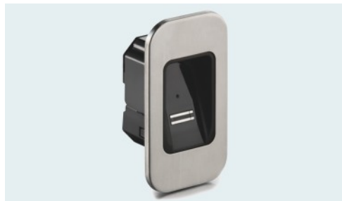
UP Fingerprint-Scanner Artikelnummer 17531 (früher B3408-003110)