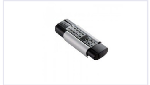
200-Befehl-Handsender 868 Mhz Artikelnummer 16651 (früher B3408-003021)