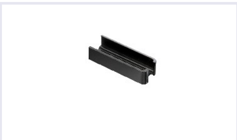
Wandhalterung 4-Kanal-Handsender Artikelnummer 13856 (früher B3408-002451)