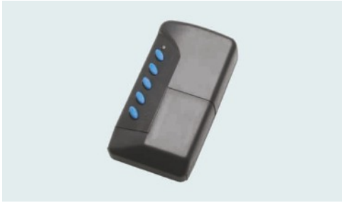
5-Befehl-Handsender 868 Mhz Artikelnummer 12571 (früher B3408-000022)