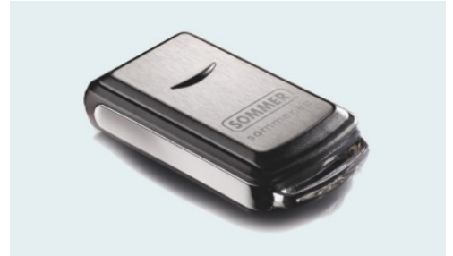
4-Befehl-Handsender "Slider" 868 Mhz Artikelnummer 16604 (früher B3408-002618)