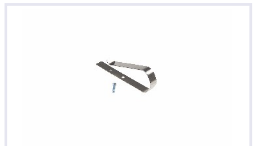
Halteclip 4-Kanal-Handsender Artikelnummer 13867 (früher B3408-002462)