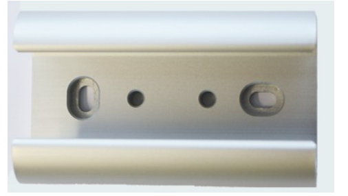
Wandhalter für Telecody Artikelnummer 13715 (früher B3408-002277)