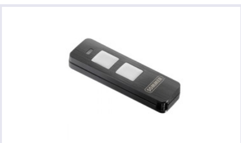
2-Befehl-Handsender Pearl Twin (für Tiefgaragen) Artikelnummer B3408-003037