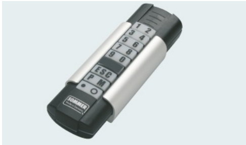
Telecody 12-Befehl 868 Mhz+ Handsender Artikelnummer 13869 (früher B3408-002465)