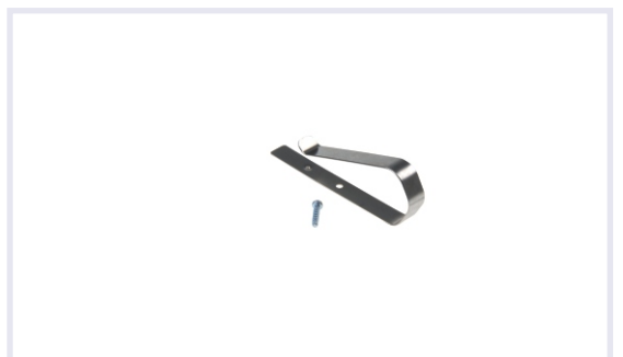
Halteclip 4-Kanal-Handsender Artikelnummer B3408-002462