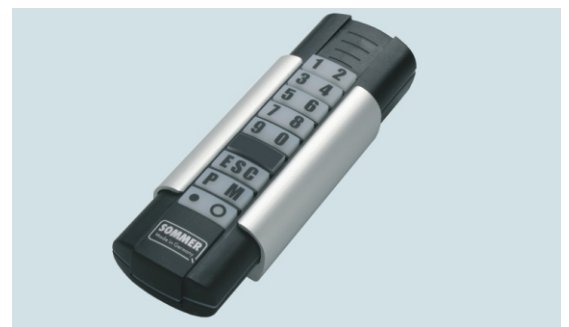
30-Befehl-Handsender 868 Mhz Artikelnummer B3408-002284