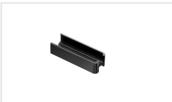
Wandhalterung 4-Kanal-Handsender Artikelnummer B3408-002451