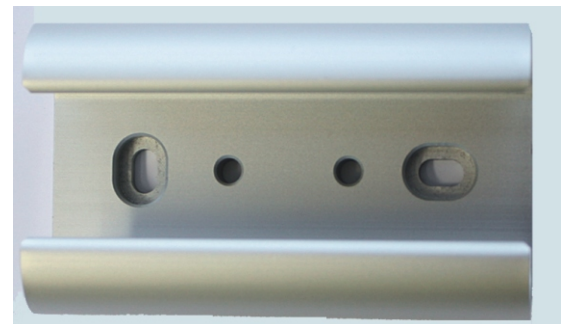
Wandhalter für Telecody Artikelnummer B3408-001271