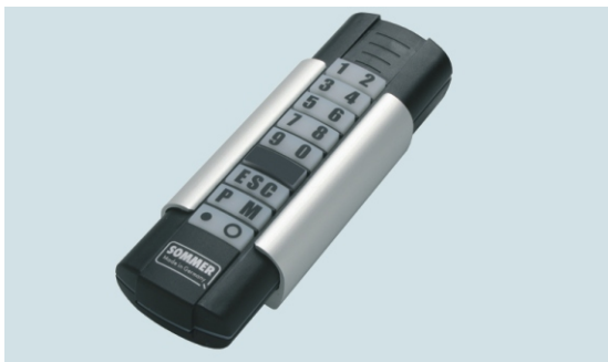
Telecody 12-Befehl 868 Mhz+ Handsender Artikelnummer B3408-002465