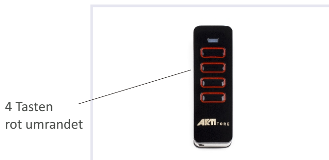
4-Befehl-Handsender 868 Mhz Artikelnummer B3408-003042