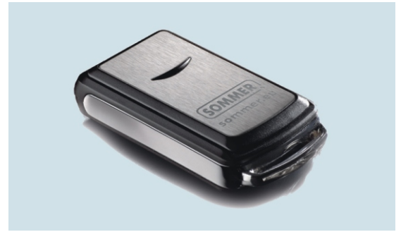
4-Befehl-Handsender "Slider" 868 Mhz Artikelnummer B3408-002618