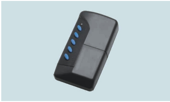
5-Befehl-Handsender 868 Mhz Artikelnummer B3408-000022