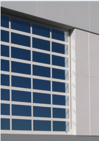
Vollverglasung, thermisch getrennte Profile (K 820)

Mit AKM TORE haben Sie einen Partner an Ihrer Seite, der mit innovativen Entwicklungen auf die Anforderungen des Marktes reagiert – ob es um die Energieeinsparverordnung geht oder die flexible Umsetzung anspruchsvollen Designs.