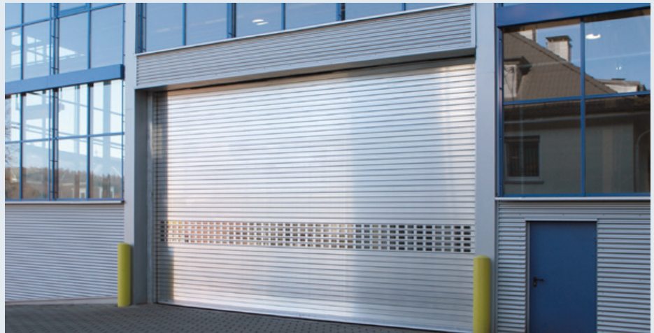
Isoliertes Rolltor (KI 100 ISO-plus)