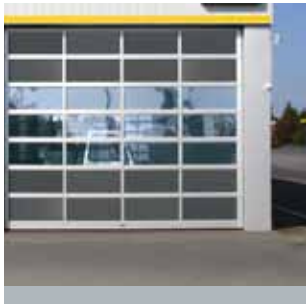
Ausführung mit Aluminium-Sandwich-Blechen