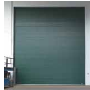
Geschlossene Ausführung mit 80-mm-PUR-Hartschaumpaneelen