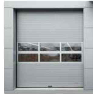
Integrierte Sichtsektionen mit Dreifach-Kunststoffverglasung

INNOVATION 80-mm-Paneele + isolierte Sichtsektionen kombinierbar