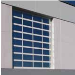
Vollverglasung mit thermisch getrennten Profilen

INNOVATION Thermisch getrennte Aluminiumprofile